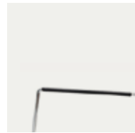
Upholstered arms Brazos tapizados