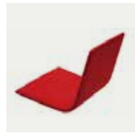
Parallel stitching upholstery Tapizado con costuras paralelas